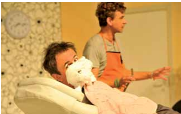
Szalone nożyczki