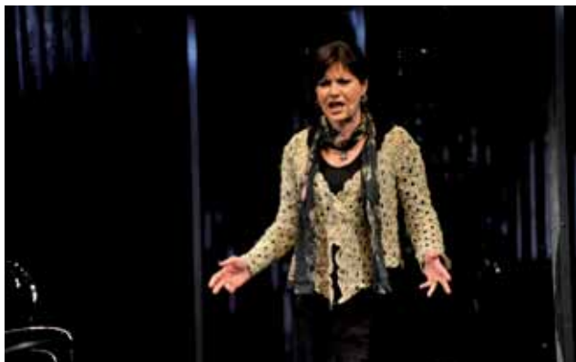
Cafe Sax, fot. M. Strudziński

Cafe Sax – piosenki Agnieszki Osieckiej , reż. Maciej Korwin