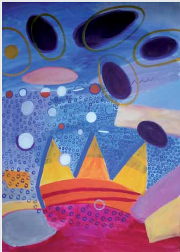
Lidia Ziemińska Wielki błękit i zatopiona fabryka 100 x 70 cm, akryl 2018