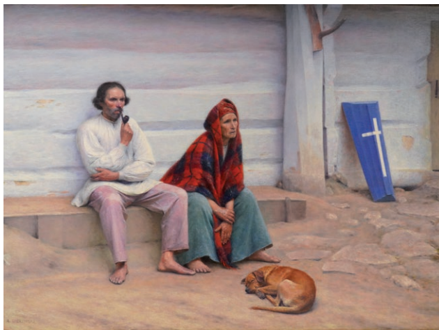
Aleksander Gierymski "Trumna chłopska" Muzeum Narodowe w Warszawie

To kluczowa wystawa tegorocznych obchodów 100-lecia Muzeum im. Janka Malczewskiego w Radomiu.