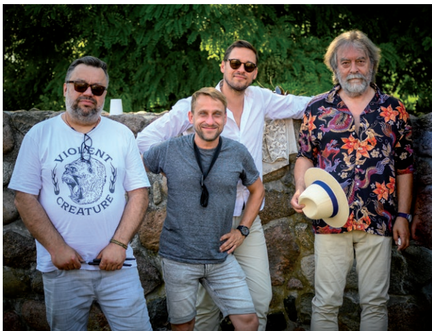
New Quartet