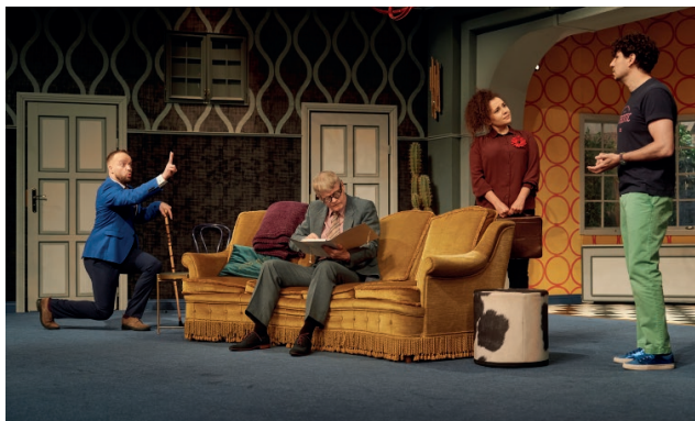
Ryzykowna forsa 2023