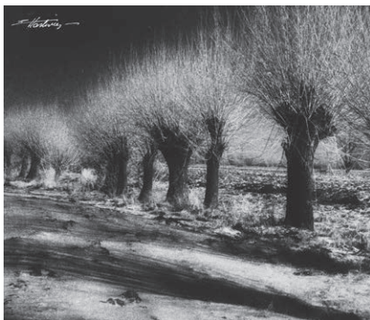
Mazowieckie krajobrazy

Muzeum jest czynne dla zwiedzających w godzinach: poniedziałek–piątek 9.00–17.00; sobota–niedziela 10.00–18.00