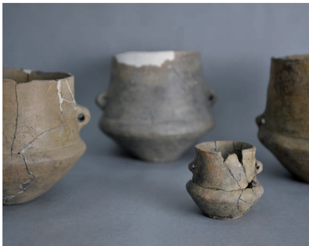
Amfory kultury łużyckiej

Wernisaż Po śmierci ku słońcu. Cmentarzyska ciepłopalne z epoki brązu i wczesnej epoki żelaza