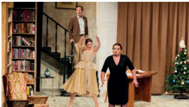
Przyjazne dusze

Akcja sztuki rozgrywa się w domu, który należał niegdyś do autora popu-