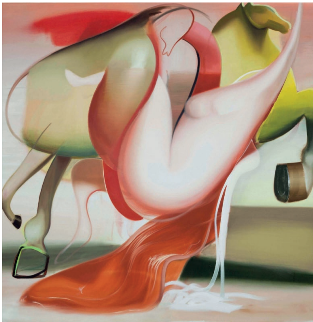
Katherina Olschbaur, Weeping Horses, 2018

W 2024 roku Polska obchodzi 20. rocznicę przystąpienia do Unii Europejskiej, co jest doskonałą okazją do pokazania bogactwa kulturalnego naszego kontynentu i łączących nas wartości. W Elektrowni można oglądać wystawę, która pokazuje różne aspekty twórczych postaw artystów z kilku europejskich krajów, m. in z Austrii, Bułgarii, Francji, Irlandii, Litwy, Niemiec, Polski i Rumunii. Ideą przyświecającą tej prezentacji jest spojrzenie na możliwości „łączenia się przez sztukę” między krajami Unii Europejskiej i budowania wspólnej tożsamości poprzez nią. Wystawa czynna do 1 września. Kurator: Paweł Witkowski.