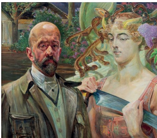
Jacek Malczewski – Autoportret z Thanatosem (z Meduzą), 1920 r.

Jacek Malczewski został Patronem Roku 2024. To impuls do zorganizowania wystawy w 170. rocznicę urodzin patrona muzeum. Pokazane zostaną na niej prace artystów, z którymi Malczewskiego łączyły relacje mistrz-uczeń bądź stosunki koleżeńskie, ale też tych, których twórczość mogła mieć wpływ lub stanowić inspirację dla rozwoju jego malarstwa. Tytułowy kontekst będą stanowić prace artystek i artystów takich, jak m.in. Jan Matejko, Maurycy Gottlieb, Witold Pruszkowski, Olga Boznańska. Zaprezentowane prace zostaną wypożyczone z instytucji muzealnych, zarówno narodowych (m.in. Warszawy, Krakowa, Poznań, Szczecin, Kielc, Lublina), jak regionalnych (m.in. Muzeum Górnośląskie w Bytomiu), ale też z wielu kolekcji prywatnych, a także zbiorów własnych naszego muzeum. Będzie to nie tylko podróż poprzez życie wielkiego artysty, ale i próba zgłębienia przynajmniej w części tak różnych wątków pojawiających się w jego ma- [ 38 ]