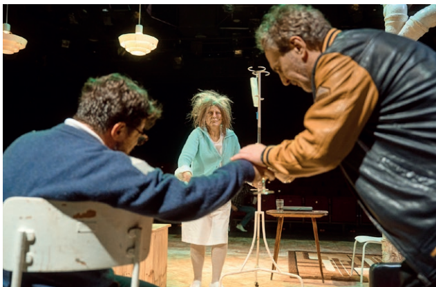
Pół na pół

chcą się podzielić pół na pół – ale czy mama to przeżyje? Ale czy jest winna? Tu wszyscy odpowiedzą za swoje... Śmiesznie, strasznie, kryminalnie. To zabawny horror, gdzie ciemna strona duszy i jej nieporadna głupota stanowią niezłą pożywkę dla dobrej zabawy ale też ważnej refleksji. Uniwersalna, ponadczasowa opowieść o karykaturalnych relacjach rodzinnych w dobowej obsadzie.