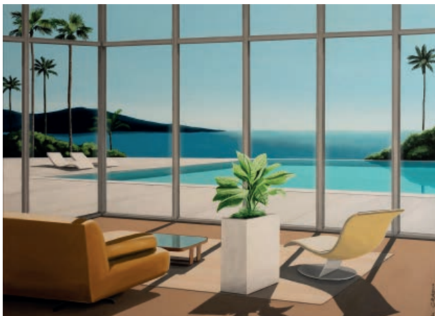
Dariusz Grabuś, W pogoni za słońcem , 2022