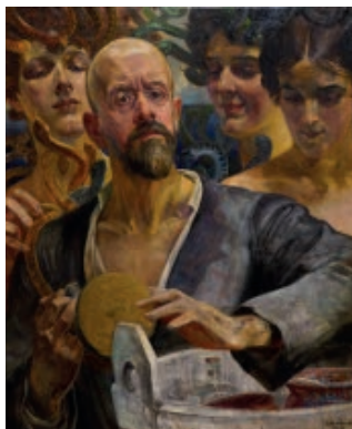
Jacek Malczewski 1918 Autoportret z Gorgonami

Jacek Malczewski został Patronem Roku 2024. To impuls do zorganizowania wystawy w 170. rocznicę urodzin patrona muzeum. Pokazane są na niej prace artystów, z którymi Malczewskiego łączyły relacje mistrz-uczeń bądź stosunki koleżeńskie, ale też tych, których twórczość mogła mieć wpływ lub stanowić inspirację dla rozwoju jego malarstwa. Tytułowy kontekst stanowią prace takich artystów jak Jan Matejko, Maurycy Gottlieb, Witold Pruszkowski, Olga Boznańska. Zaprezentowane prace zostały wypożyczone z instytucji