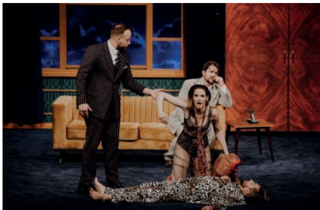
Okno na parlament

Spektakl Okno na parlament , reż. Jarosław Tumidajski