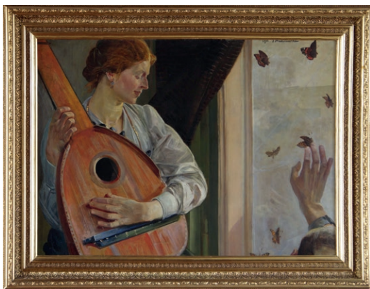
Zdjęcie udostępnione przez Muzeum im. Jacka Malczewskiego