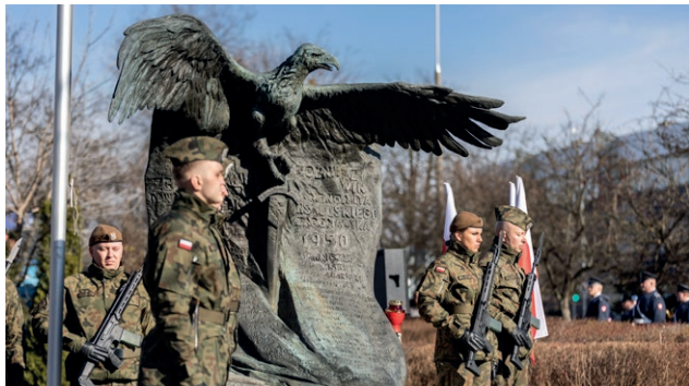
Fot. A. Wróblewska / UM Radom