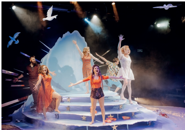
Café Luna