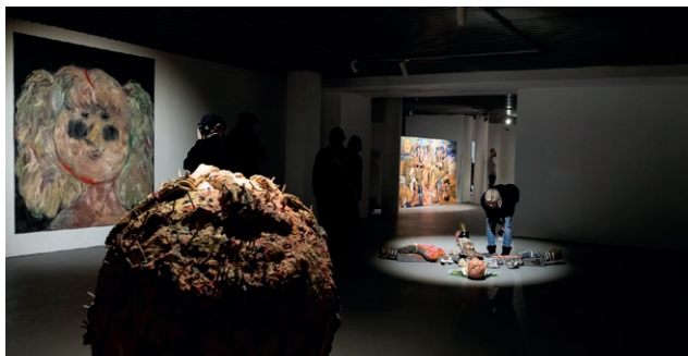
Fot. Eliza Wilczyńska

Wystawa w MCSW Elektrownia jest największą do tej pory prezentacją twórczości Si On w Polsce. Artystka urodziła się w Korei Południowej, studiowała malarstwo w Japonii, kilka lat mieszkała w Nowym Jorku, aktualnie żyje i tworzy w Krakowie.