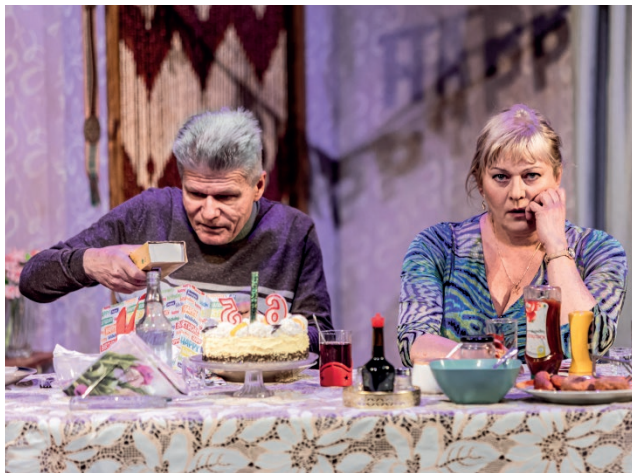
Spektakl Tęsknię za domem

Spektakl Tęsknię za domem , reż. Radosław B. Maciąg