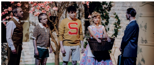
Śmierć komiwojażera , fot. Marta Dudzińska

Spektakl Śmierć komiwojażera , reż. Radosław Rychcik