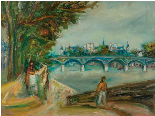
Jakub Zucker Paryż nad Sekwaną, wł. Muzeum im. Jacka Malczewskiego w Radomiu.

Kolejny Czwartek z Esterką poświęcony będzie twórczości Jakuba Zuckera , wybitnego malarza pochodzącego z Radomia. W programie m. in. wykład Renaty Metzger i prezentacja obrazów artysty z kolekcji Muzeum im. Jacka Malczewskiego oraz kolekcjonerskiego albumu z autografem Mistrza. Prowadzenie: Marcin Kępa.