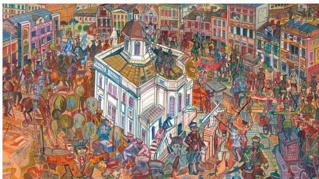
Edward Dwurnik, Cykl IX Podróże autostopem, nr 125 – Radom'76

Wernisaż Głód wolności. Radomski bunt. Czerwiec 1976